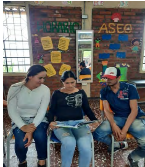
Foto 10 interacción de padres de familia con la guía

A continuación, podemos observar el apoyo y la participación activa tanto de estudiantes como padres de familia, los cuales se mostraron muy complacidos con el proceso.