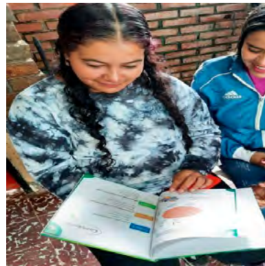
Foto 03 interacción de padres de familia con la guía

Cada una de las actividades propuestas anteriormente fueron adaptadas a cada uno de los cuatro momentos para crear una guía de aprendizaje de Escuela Nueva en comprensión lectora como segunda cartilla , la cual, permitiría la intervención a la problemática detectada en esta población objetivo, desde las necesidades e intereses