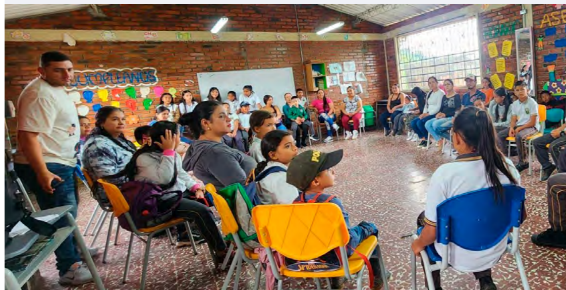
Foto 11 socialización padres de familia

En esta última sección, el lector podrá encontrar algunas conclusiones que se generaron a partir de los objetivos propuestos y se brindan algunas recomendaciones para tener en cuenta en intervenciones futuras.