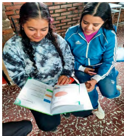
Foto 04 interacción de padres de familia con la guía

Además, se pretendió proponer actividades que permitieran la integración de habilidades como: la inferencia, la identificación de ideas principales, la predicción y la interpretación de textos. Asimismo, se abordaron aspectos de vocabulario y gramática, con el fin de enriquecer el lenguaje y facilitar la comprensión de los contenidos.