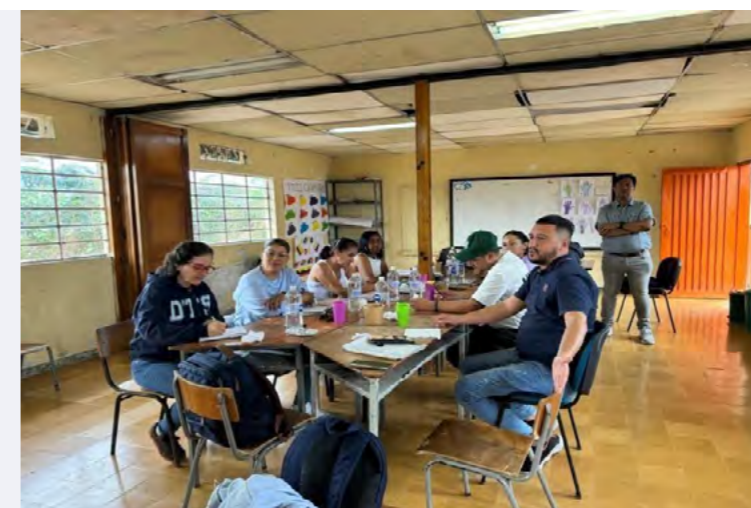
Foto 09 microcentros (red de apoyo académico)

Los estudiantes disfrutaban leer en silencio, escuchar al maestro, leer en parejas, se observa una rutina monótona de lectura en clase, por ello, no disfrutaban de otras técnicas de lectura en las que se posibilita la inferencia, demostrando los alumnos debilidad en esta competencia. (p. 47)