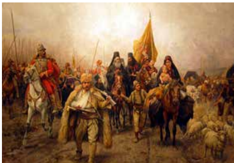
Jovanović, P. (1896). Migration of the Serbs. Oil on canvas.

Los extranjeros pobres que migran son humillados y asesinados en las democracias “florecientes” y en los países menos libertarios. El migrante no dispone de suficientes estructuras de acogida; en la mayoría de las ocasiones son personas con baja representatividad económica: eso los torna vulnerables y detestables. El signo que se les extiende es el del abandono, de culpabilidad y de no merecer adentrarse por otros espacios y culturas.