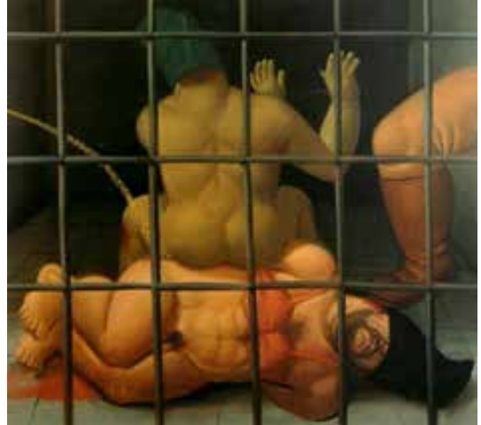
Botero, F. (2005). Abu Ghraib. Óleo sobre lienzo

Botero da cuenta, en algunas de sus pinturas, las torturas denunciadas y condenadas por Amnistía Internacional entre 2003 y 2004 en la prisión Abu Ghraib, en Irak.