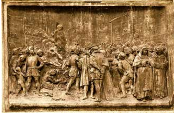
Palacio ducal de Venecia. (1592). Giordano Bruno interrogado por los inquisidores en 1592 sobre sus supuestas herejías.

Racismos académicos e institucionales han tenido que padecer muchos intelectuales por hacer algunas claridades sobre procedimientos religiosos, políticos, militares o económicos. Perseguir intelectuales y asesinarlos ha sido una práctica de casi todos los poderes; no es fácil para los intelectuales que no cuentan con ningún poder cuando deciden adoptar posturas.