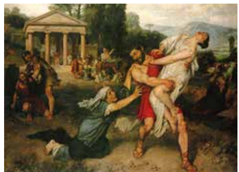
Pradilla, F. (1874). El rapto de las sabinas . Óleo sobre lienzo, Museo el Prado.

Ellas han sido sometidas y humilladas; incluso algunas religiones las consideran seres inferiores. Los datos de violencia contra las mujeres son penosos. Los abusos y exclusiones las siguen padeciendo en los cinco continentes. El feminicidio es la expresión que nombra todo acto criminal cometidos por hombres contra las mujeres. Es histórico que en las guerras las mujeres terminan siendo un botín, pero en los tiempos del siglo XXI aún se siguen presentando como tal.