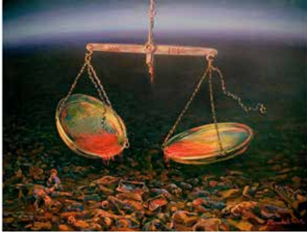
Khachatryan, M. (2005). Armenian Genocid, It Is Devoted To Sacred Memory The Triptych A Part. Oil on canvas

Entre millón y medio y dos millones de personas murieron entre 1915 y 1923 por los ataques de los otomanos contra el pueblo armenio. Ese es el genocidio más grande del siglo XX que aún no alcanzamos a reconocer en toda su magnitud. De acuerdo con Ghurkasian et al (2016, p. 16):