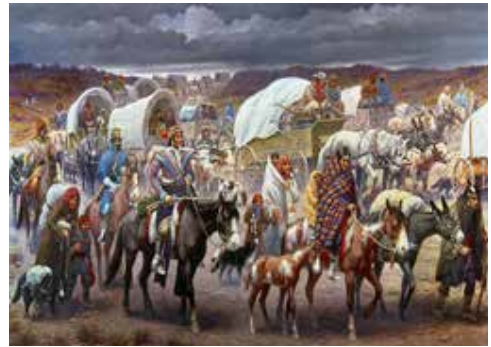
Lindneux R. (1942). The Trail of Tears. The ethnic cleansing of the Cherokee nation by the U.S. Army, 1838.

Dos casos nos muestran esta dura realidad de radicalismo contra los indígenas: Argentina tiene varios hechos lamentables, en 1927 asesinaron a cerca de 700 conocido como la masacre de Napalpi. La masacré de los Pilagá en Argentina en 1947, realizada por fuerzas estatales leales a Domingo Perón. El hecho apenas se conoció a partir del 2005, cuando fueron reivindicados unos 2.000 indígenas, cientos de ellos masacrados.