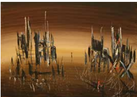
Soshana, F. (1963). War in Sarajevo I. Óleo sobre lienzo.

Lo que allí sucede es el horror de los horrores, es el atardecer de una humanidad, es el anochecer de Europa. Entre 1991 y 2001, la antigua Yugoslavia fue la gran pena del mundo pos grandes guerras; el dolor de lo que parecía otro de esos viajes grises por Europa que no ha sido ejemplo cuando de exterminar a los demás o de autoexterminarse se trata.