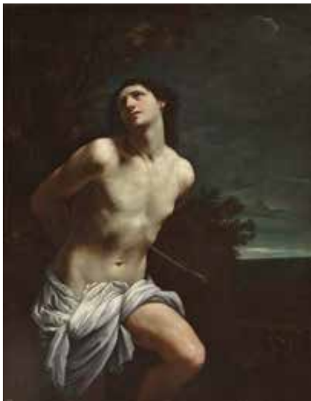
Reni, G. (1617). San Sebastián, museo el Prado. Óleo sobre lienzo.

¿Por qué se conocen tan pocos narcos o jefes de bandas criminales gay? No sólo hay radicalidad en los llamados ciudadanos de bien; también los ciudadanos que odian a la otra sociedad tienen sus reglas, sus normas de exclusión, saben de sus cegueras y sorderas. La primera matanza reconocida se da en Holanda entre 1730-1731, alrededor de 42 asesinatos y más de 250 encarcelados.