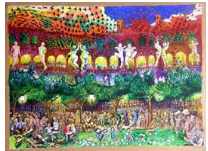
Paintings of the genocide in Rwanda. (2006). Acquarela

El gobierno de Ruanda, de mayoría Hutu, emprendió una acción decidida para desaparecer a los Tutsi. Entre 1961 y 1994 se asesinó a alrededor de 1.200.000 integrantes de esta comunidad. El libro El lenguaje de los huesos , de la antropóloga inglesa Clea Koff (2004) nos muestra que cerca de 250.000 Tutsi fueron asesinados o desaparecidos en 1994. De esta enorme tragedia nos faltan cifras, nos faltan palabras para describir todo el horror allí vivido.