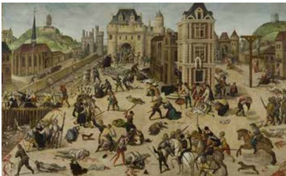
Dubois, F. (1572). Representación de la matanza de San Bartolomé.

Es la muestra que entre las mismas religiones no han existido acuerdos definitivos y se llega a variantes extremas por algunos de sus radicales; se transita a odios consumados en las peores condiciones posibles.