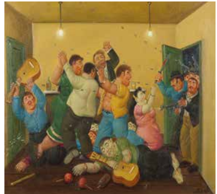
Botero, F. (2000). Masacre de Mejor Esquina. Óleo sobre lienzo.

El 03 de abril de 1988 en La Mejor Esquina, en Córdoba, grupos paramilitares realizaron una fiesta para convocar a integrantes de la guerrilla y seguidores; allí fueron masacrados 27 campesinos, entre ellos varios niños. A partir de esa fecha, se reinició en Colombia una serie de masacres donde se han asesinado más de 13 000 personas.