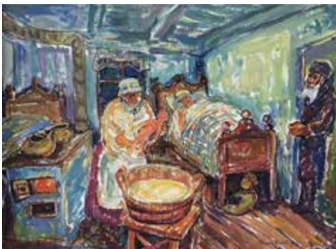
Goldberg H. (1967). Colores de la vida judía antes del holocausto. Óleo sobre lienzo.

Varias veces han padecido persecuciones, asesinatos en serie y programados, como en el holocausto de la Segunda Guerra Mundial o los sufrimientos que padecen en Palestina.