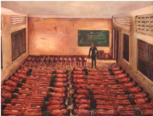
Nath V. (1980). Classroom Turned Prison. Acrylic on canvas.

Pol Pot y los Jemeres rojos asesinaron más de un millón quinientos mil camboyanos entre 1975 y 1979. Según el Museo de Memoria y Tolerancia (2015, párrafo1):