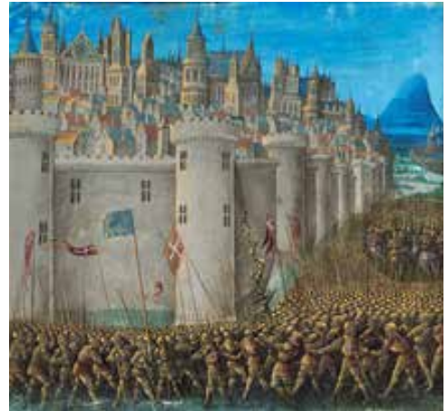
Mamerot's, S. (1474) Detail of a medieval miniature of the Siege of Antioch-Syria from Les Passages d'Outremer.

Las cruzadas entre el 1095-1291 generaron ataques radicales contra toda forma de pensamiento que se apartara del cristianismo. Los que más lo padecieron fueron los árabes, por su apuesta religiosa desligada del concepto de Jesús y sustentada en Mahoma.