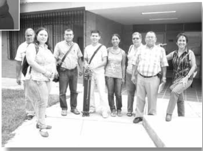
Fotografía No. 12 Miembros del grupo de investigación e integrantes de la Línea de investigación de la UCP