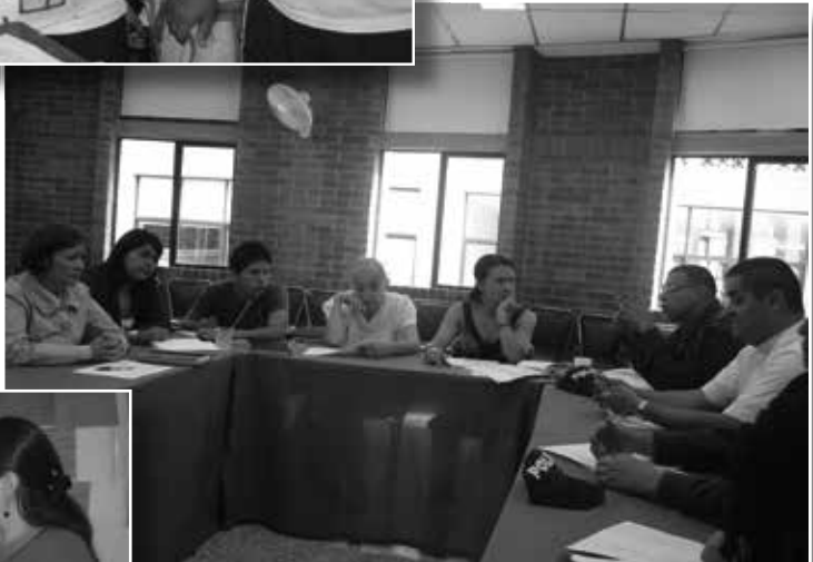
Fotografía No. 10 Taller con expertos institucionales en el tema de infancia Fuente: Archivo fotográfico del Proyecto

Fuente: Archivo fotográfico del Proyecto