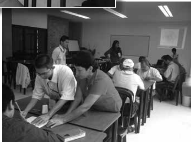
Fotografías No. 7 y 8 Taller Formulación del plan de acción con el equipo de investigación