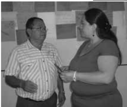
Fotografía No. 11. Líder comunitario y docente de la comunidad