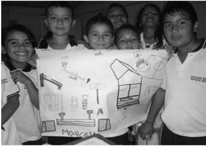
Fotografía No. 9. Taller con estudiantes Formulación del plan de acción