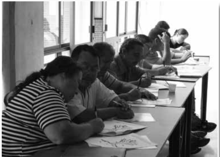
Fotografías 1, 2. Fase de alistamiento. Capacitación en IAP