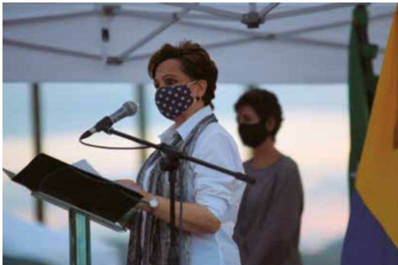
Homenaje a fallecidos durante la pandemia - 15 de octubre de 2020

centrarnos en la confianza, la energía positiva, la paz interior y, sobre todo, poner la fe en que Dios todo lo restituye”.