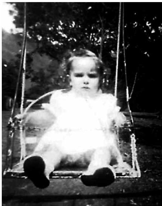
Victoria - 1962