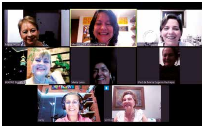
Con sus entrañables amigas