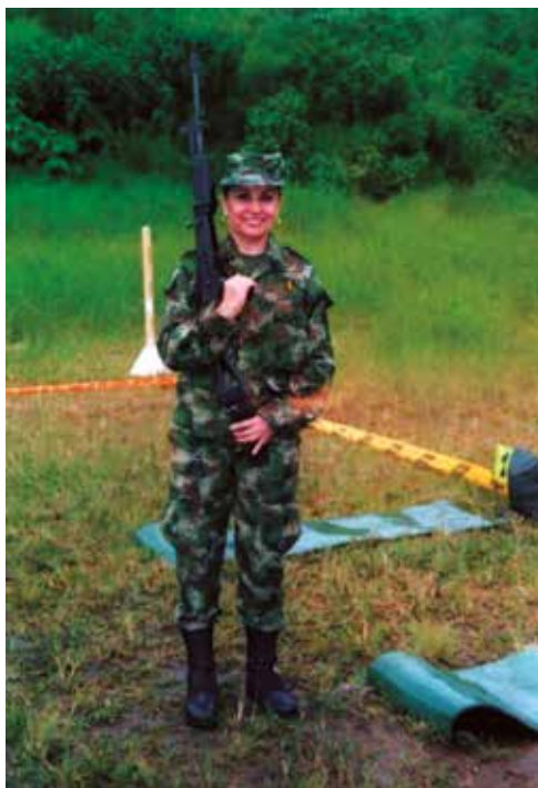
Una mujer “de armas tomar”