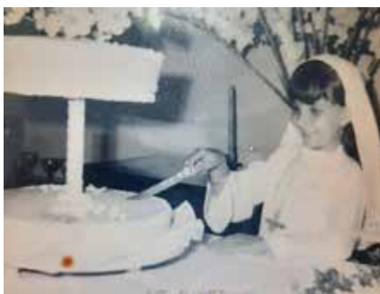
Primera comunión, Colegio Los Sagrados Corazones, 7 años – Domingo 13 de junio de 1968