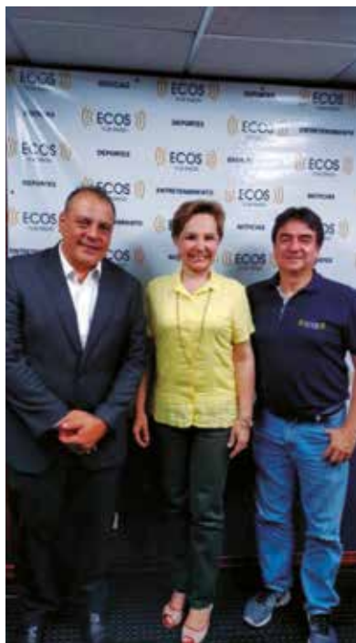
Informando en los medios locales