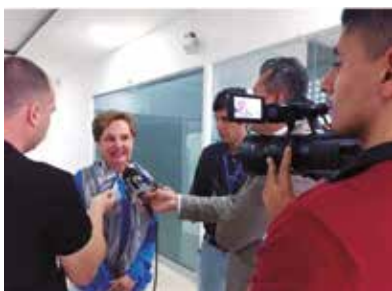
Divulgando las actividades de Fenalco Risaralda