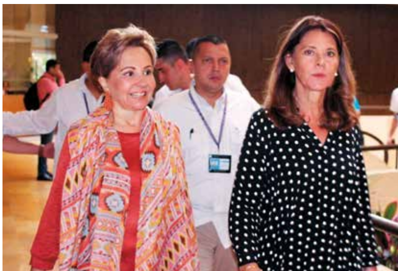
Junto a Martha Lucía Ramírez, la vice presidenta y canciller de Colombia, Comisión Regional de Competitividad - 28 de febrero de 2020