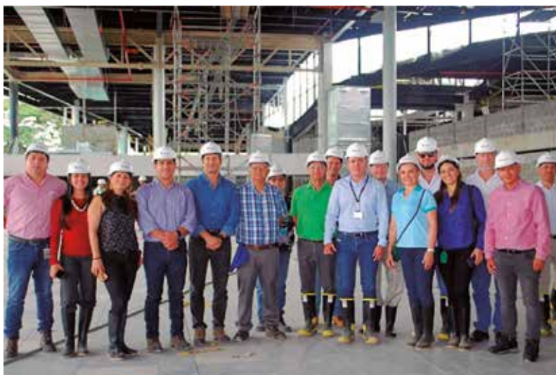
Comité Intergremial - 2019