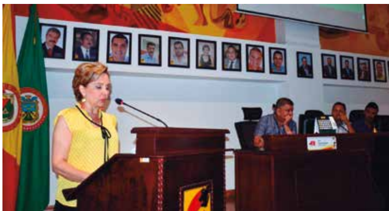
Presentación Plenaria, Concejo de Pereira; informe de labores ante el Cabildo Municipal - 18 de julio de 2019.