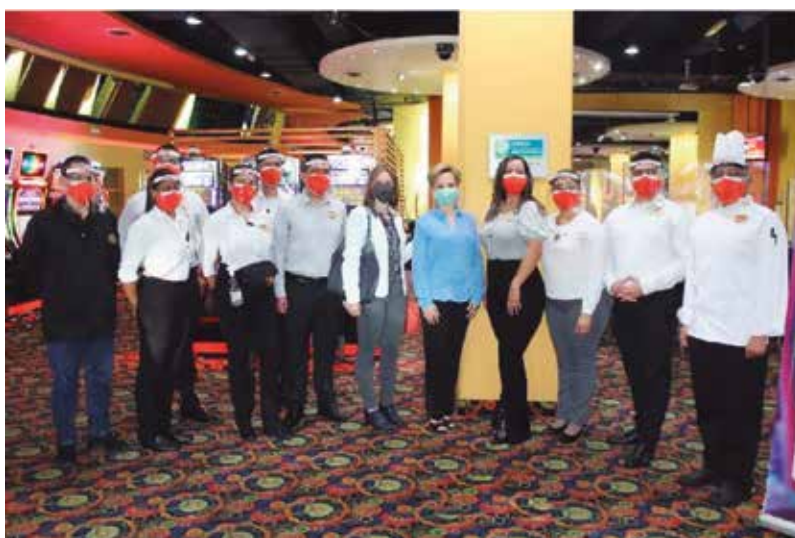
Entrega de certificado “Empresa comprometida con la bioseguridad”, a Casinos VICCA GROUP y ZAMBA - 3 de marzo de 2021