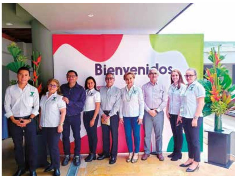
Presentación Programa: "Hecho en Pereira, lo compro" - 9 de octubre de 2019