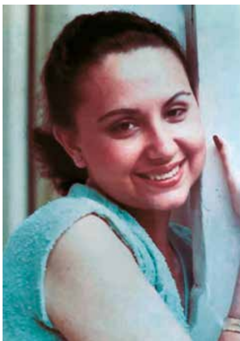
Segundo año de derecho, Universidad Libre - Domingo 27 mayo de 1979.