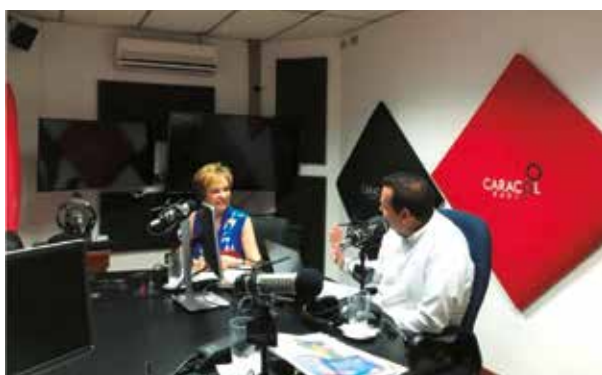
Entrevista, Caracol Básica