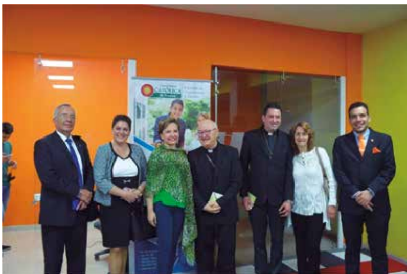
Inauguración laboratorios de Neuromarketing, Universidad Católica de Pereira – 2019