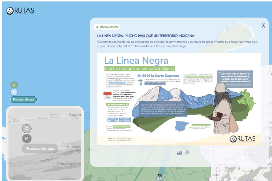
Figura 9 Infografía La Línea Negra

Otro ejemplo en otra región del país acerca de las posibilidades más ecuánimes con el ambiente es la región oriental del Vaupés, y sus relaciones implícitas en el piedemonte amazónico y la existencia del mito de la Anaconda Ancestral que une la amazonia de Venezuela, Brasil, Perú y Colombia. Son los ríos las manifestaciones de su cuerpo, y existen intercambios en todos esos corredores hídricos para hacer permanecer el equilibrio implicado con los demás seres que comparten el territorio. La sabiduría de este otro tipo de conocimiento, de una cultura chamánica tradicional, interpela los modos y maneras de accionar hoy sobre el territorio, para pensar cómo remediar el deterioro social y ambiental ocasionado por la colonia y la violencia. Uno de los conceptos más claros al respecto del sistema complejo de reciprocidad con el ambiente lo señala Luis Cayón en su libro Pienso luego creo. La teoría makuna del mundo