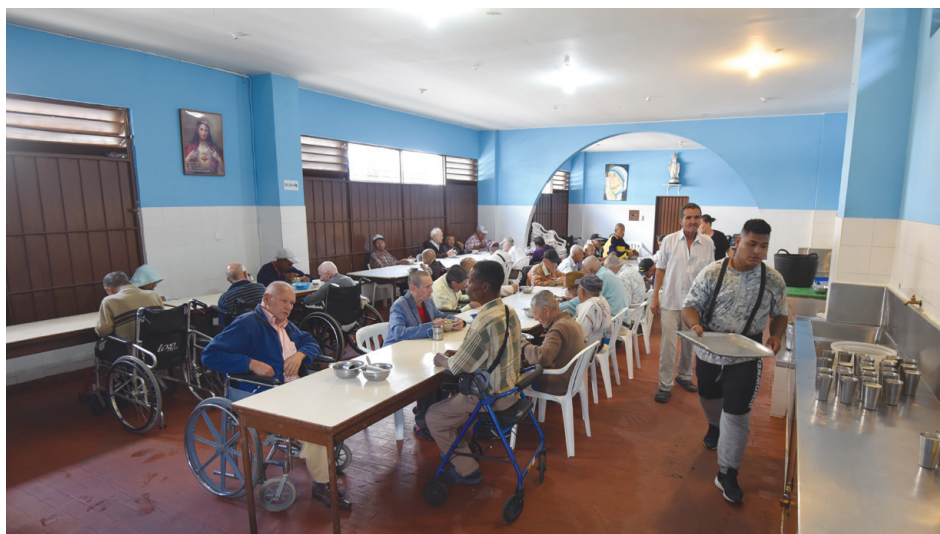
Comedor social en la sede de las Hermanas Misioneras de la Caridad Pereira