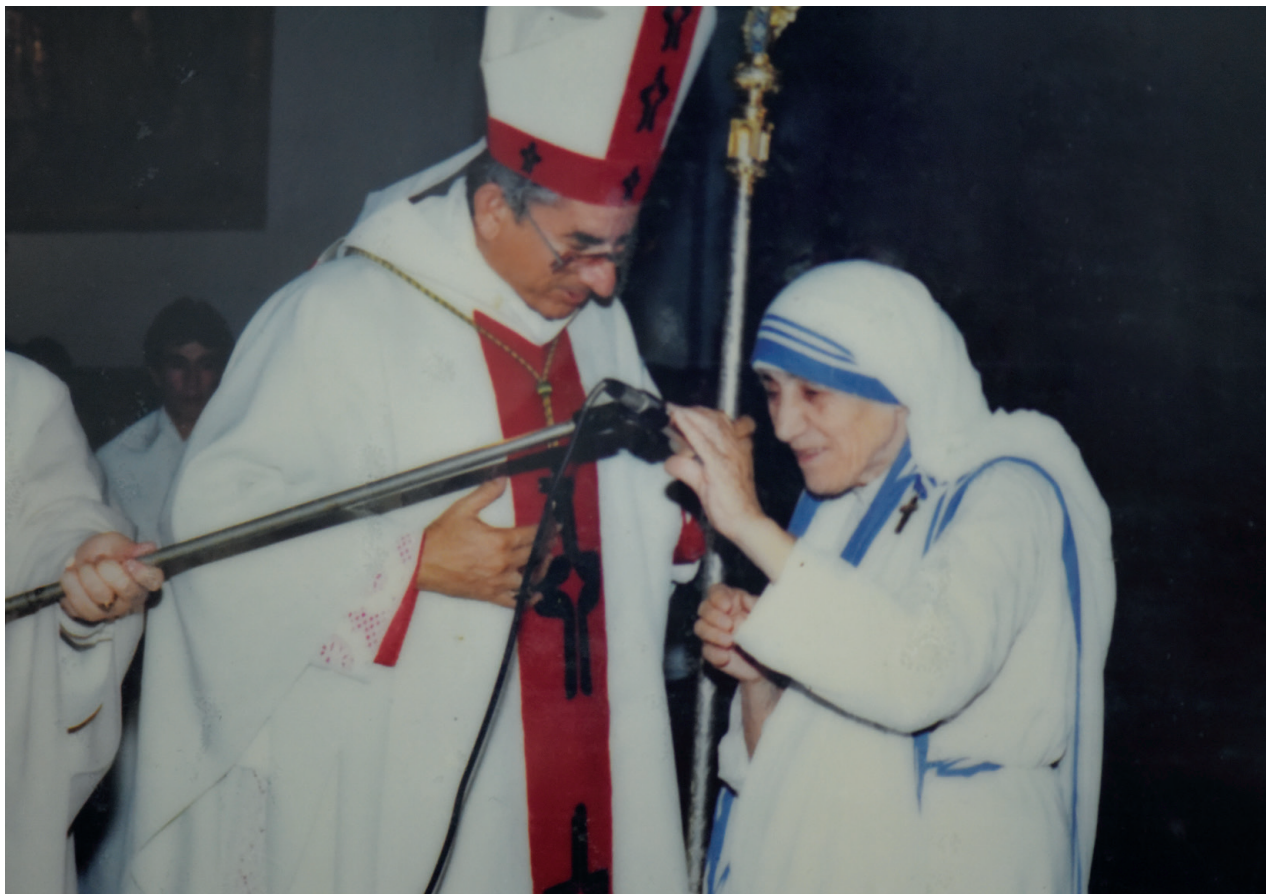
Monseñor Darío Castrillón Hoyos en compañía de la Madre Santa Teresa de Calcuta