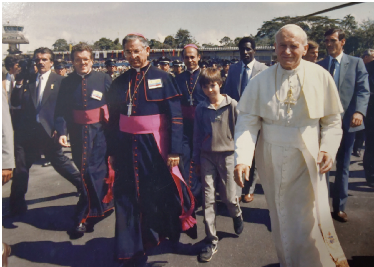
Recorrido del Papa Juan Pablo II en compañía de Monseñor Darío Castrillón Hoyos durante su arribo al Aeropuerto Internacional Matecaña de Pereira