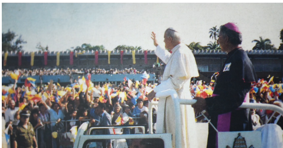
Juan Pablo II saluda a la multitud reunida en el Aeropuerto Internacional Matecaña de Pereira